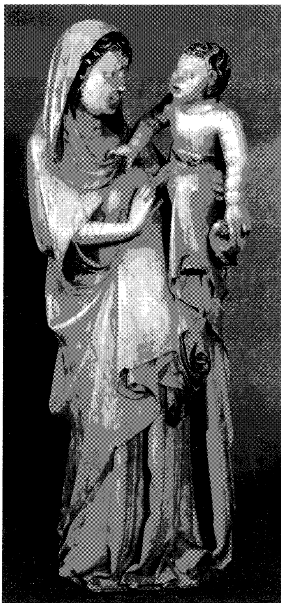
Figura 1. Mare de Déu de Sant Medir. Procedència: Ermita de Sant Medir. Conservació: Museu Diocesà de Barcelona (núm. d'inventari 287).