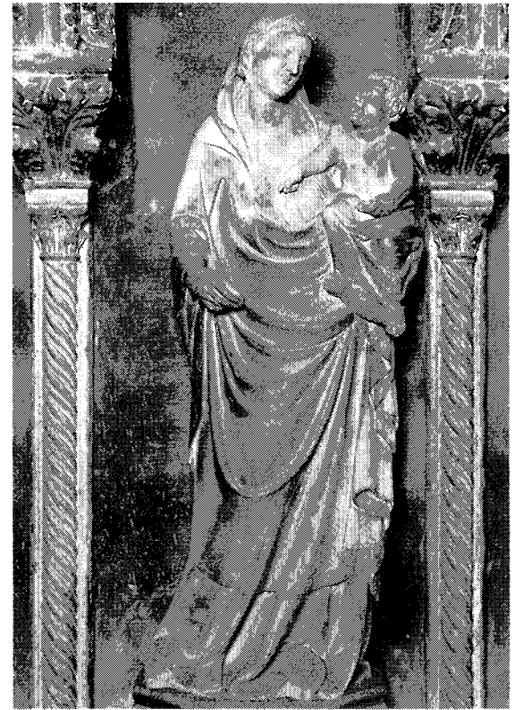
Figura 3. Madonna del Latte. Atribuïda a Andrea Pisano. Procedència: Església de Santa Maria della Spina (Pisa). Conservació: Museo Nazionale de Sant Matteo (Pisa).