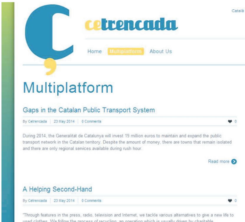
Imagen 3. Captura de pantalla de la página “Multiplatform” (“Multiplataforma”) que recoge los reportajes de la versión inglesa de Cetrencada

tudiante de Traducción e Interpretación, e incorporamos al proyecto a un profesor inglés nativo para la tutorización de esta estudiante así como de los estudiantes de Periodismo que quisieran publicar directamente en inglés. En esta edición se tradujeron ocho reportajes elaborados por los alumnos del taller de prensa al inglés de temáticas muy diversas. En la elección de los reportajes a traducir se tuvo especialmente en cuenta la atemporalidad de estos reportajes, ya que su traducción requería una publicación posterior a la edición en catalán, y que fueran temas que pudieran interesar especialmente a un público internacional, dejando de lado reportajes estrictamente locales.