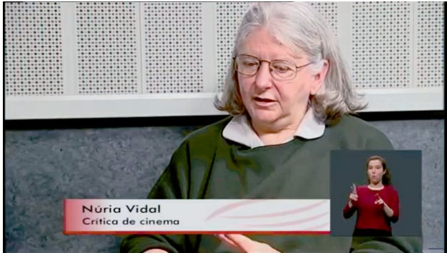
IMAGEN 6. Captura de pantalla de una entrevista del informativo de televisión signado

Al final del curso, la experiencia se ha valorado con las dos estudiantes implicadas 1 y con Roger Cassany, uno de los profesores de televisión. En general, el trabajo realizado se ha valorado muy positivamente: para las estudiantes es una buena oportunidad para practicar y una posibilidad efectiva de difusión on-line de su trabajo; por otro lado, para los informativos realizados en el taller, es una forma de aumentar su accesibilidad para la comunidad sorda y de asumir una tarea que, más allá del debate existente con la subtitulación, busca promover la integración social y el reconocimiento de las minorías. Sin embargo, tanto el docente como las estudiantes detectan todavía algunos problemas, especialmente organizativos, probable consecuencia de tratarse de una experiencia nueva de este curso.