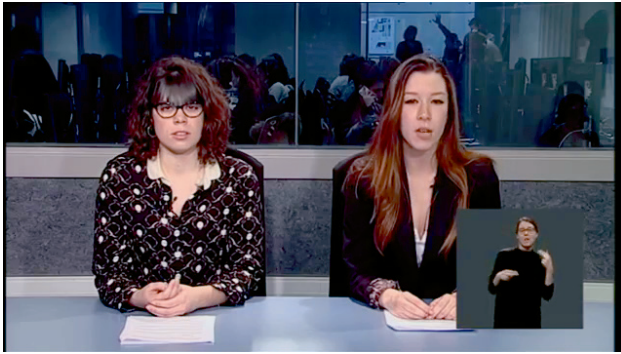
Imagen 5. Captura de pantalla de un informativo del taller de televisión signado