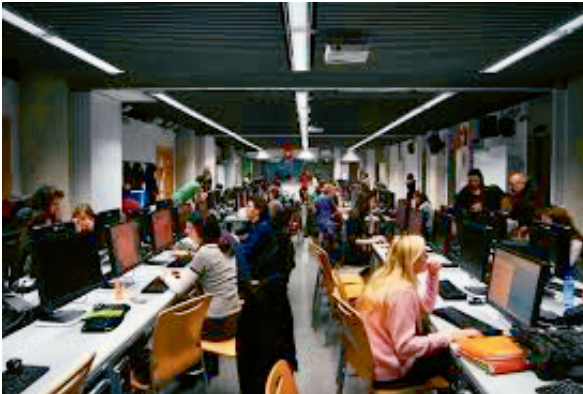
Imagen 1. La redacción integrada

Su peso crediticio es de 24 ECTS (600 horas de trabajo) y se desarrolla a lo largo de todo el curso académico, de octubre a junio, durante tres mañanas a la semana, de 9 a 14 h.; es decir, durante un total de 15 horas semanales. Al comenzar el curso, el grupo, formado por 80 estudiantes, se divide en cuatro y cada uno trabaja en un medio diferente: prensa impresa, radio, televisión e internet. Pasadas siete semanas y media (una cuarta parte del curso), el alumnado cambia de medio: los que estaban en prensa impresa pasan a radio, los de radio pasan a televisión, y así sucesivamente.