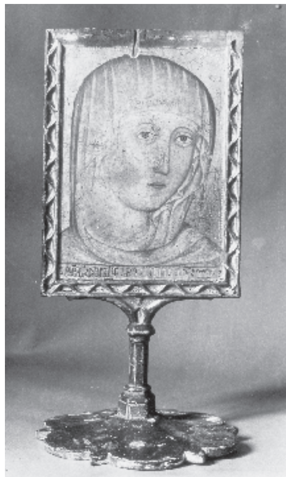
Figura 2. Verònica. Catedral de Tortosa.

Les dades documentals que esmenten la verònica del rei Martí entre 1397 i 1437, quan és donada a la catedral de València, i fins i tot després, destaquen precisament pel fet de mostrar que era una de les relíquies més estimades pel monarca i els seus successors. Si aquesta és una valoració basada en el caràcter pietós i alhora simbòlic de la peça—cal recordar que era un retrat «real» de Maria—, encara hauríem d'afegir a aquest fet la importància que a nivell artístic tingué la verònica del rei Martí en tant que punt de partida d'una tipologia d'indubtable èxit, els reliquiariis pediculats amb santes façs, i altrament per la difusió d'una iconografia a la qual donà lloc, la santa faç de la Mare de Déu, seguida primer per un grup de veròniques marianes