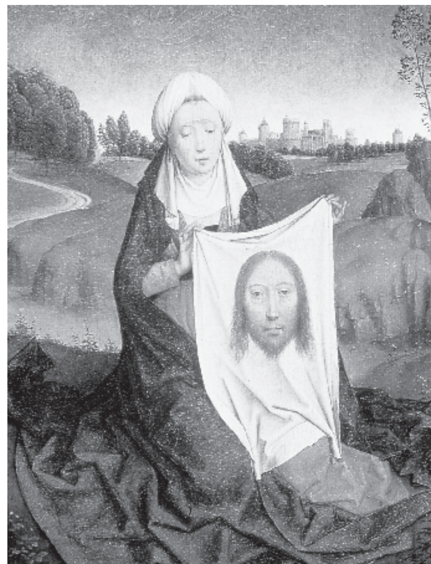
Figura 6. Díptic. Verònica amb la santa faç de Crist. Hans Memling, ca. 1470-75. Washington, National Gallery of Art.