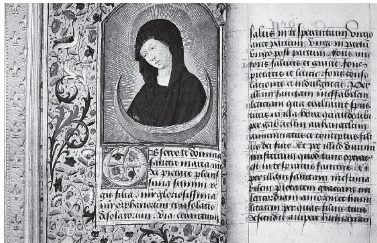
Figura 9. Llibre d'hores. Mestre de Petrarca, ca. 1490.

70. S'utilitza la paraula verònica per al·ludir l'oratori on es conservava la Salus Populi Romani a Santa Maria Maggiore a Roma, vegeu-ne l'esment a P. JOUNEL: Le culte des saints dans les basiliques du Latran et du Vatican au douzième siècle , Roma, 1977, p. 387. Aquesta informació m'ha estat facilitada per Francesca Español.