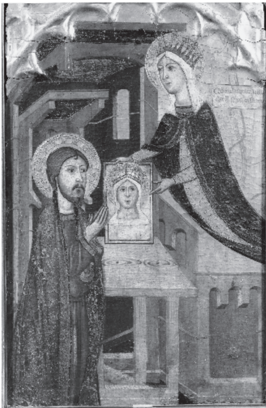
Figura 5. Compartiment del retaule del gremi de pintors i fusters de València. Museo de Bellas Artes San Pío V de València.

Relicario: Primeramente se venera, en el Altar portátil de nuestro Rey D. Martín, que es de alzada de palma y medio de altitud lo mismo