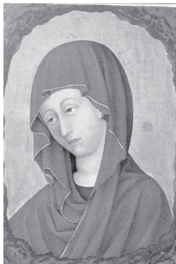
Figura 8. Llibre d'hores de René d'Anjou Bartholomé Van Eyck.

ser significatiu que el quadre commemoratiu de l'esdeveniment es conservés a la Sainte Chapelle, l'oratori personal del rei 61 ; atesa la cronologia de la visita del futur monarca a Avinyó, el díptic dataria del 1342 i per tant seria anterior a les primeres veròniques catalanes.