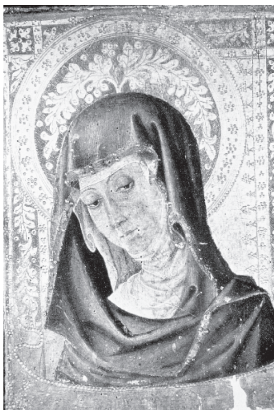
Figura 4. Verònica.

membres de la Confraria de la Puríssima de Barcelona, que tenien com a finalitat donar més solemnitat a la festa de la Concepció 36 . És per aquest motiu que Martí promogué una processó que circulava pels carrers més importants de la ciutat. El text que recull les provisions ja ha estat transcrit anteriorment i posa de relleu el compromís del rei per deixar anualment la verònica. S'ha d'insistir, doncs, en el fet que Martí I s'ofereix a deixar la imatge per a una ocasió singular: la celebració de la Puríssima, festa a la qual el rei, els consellers de la ciutat i els altres confreres volien donar solemnitat i protagonisme, i equiparar-la d'aquesta manera a les grans festivitats marianes del calendari litúrgic.