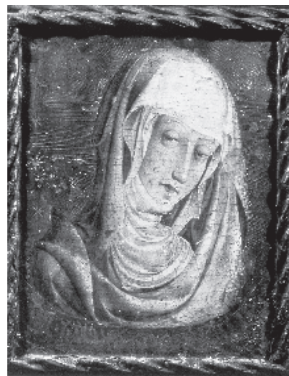
Figura 3. Verònica. Museo de Bellas Artes San Pío V de València.