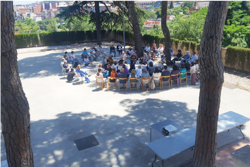
Vesak Saga Dawa 2019.