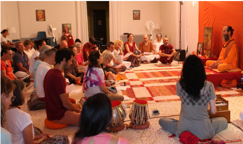
Recés de ioga a Besalú.