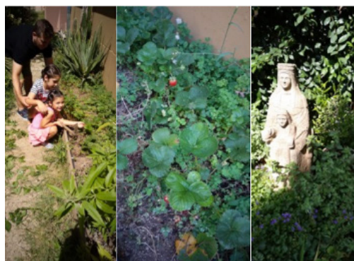
Imatges del jardí de la parròquia.