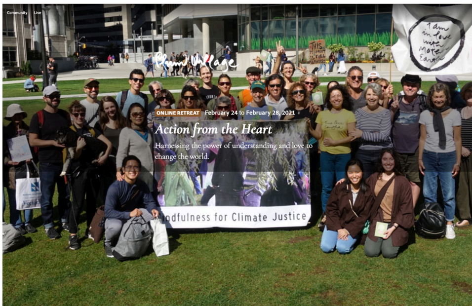
Anunci d'un recés online per activistes climàtics.