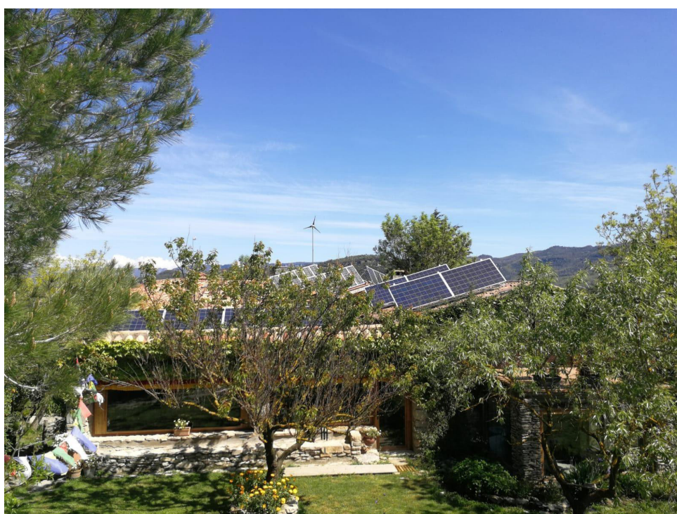
Plaques fotovoltaïques a Casa Virupa.