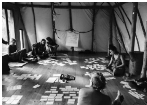
Curs al Centre Dharma.