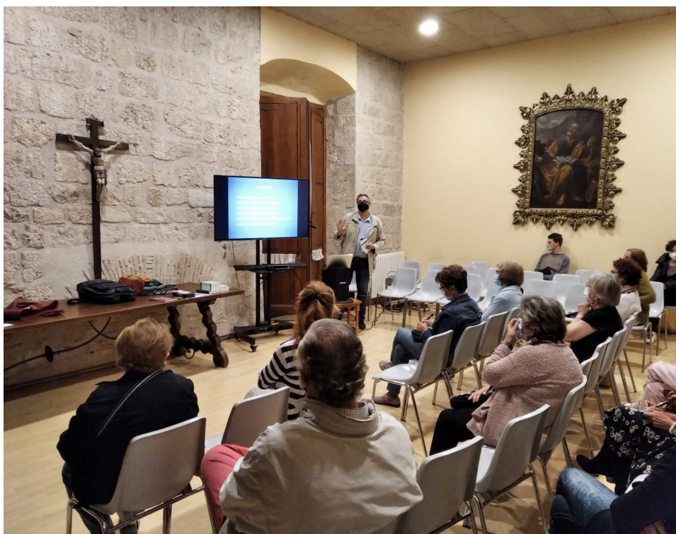
La parròquia va crear un grup de reflexió al voltant de l'encíclica del Papa Francesc Laudato si'.

https://santperedoctavia.org ; laudatosi@santpereoctavia.org