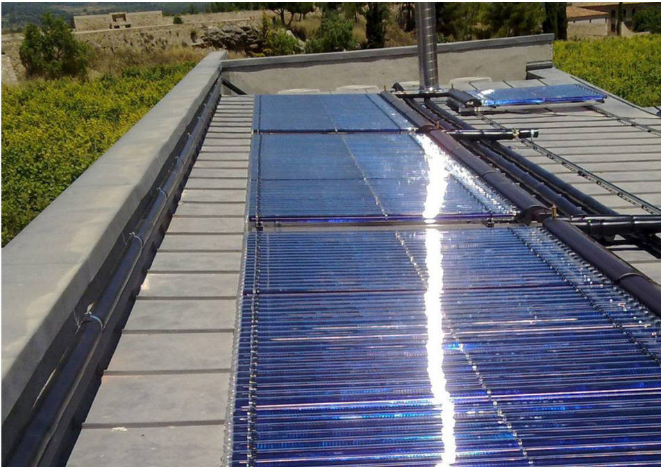
Teulada fotovoltaica al sostre del Palau de l'Abat del monestir de Poblet.