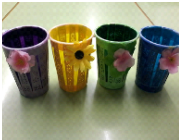
Manualitat a partir de gots reutilitzats i un ventall trencat.