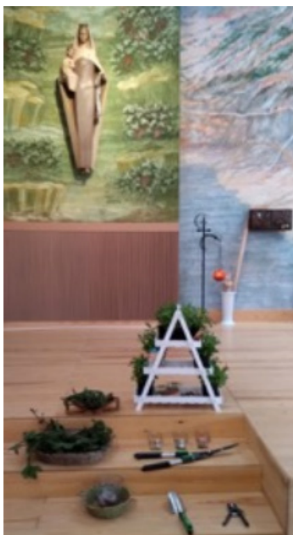
L'interior de l'església el diumenge, amb els estris del jardí.

Carrer Josep Maria Trias de Bes, 9. 08970 Sant Joan Despí. Barcelona.