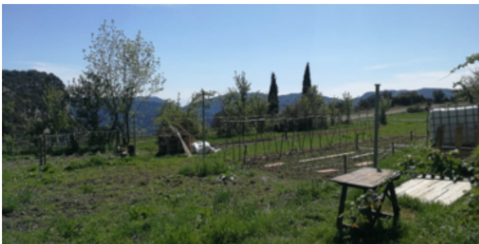
Hort de Casa Virupa actualment.