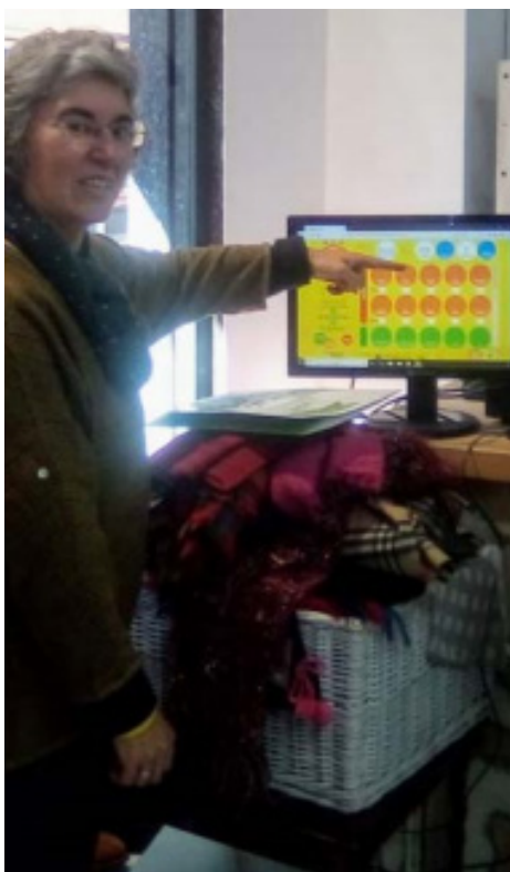
Calculadora de CO2.

http://reutilizayevitaco2.aeress.org/cat/