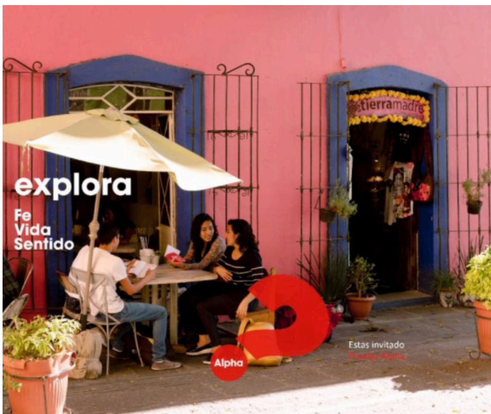
Rètol dels Cursos Alpha que es fan a Sant Quirze del Vallès.