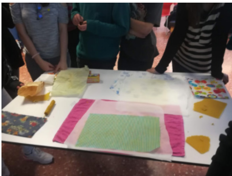
Taller d'embolcalls per tal de reduir els residus de l'esmorzar.

https://sites.google.com/a/fje.edu/plantem-treballem-i-recollim/home