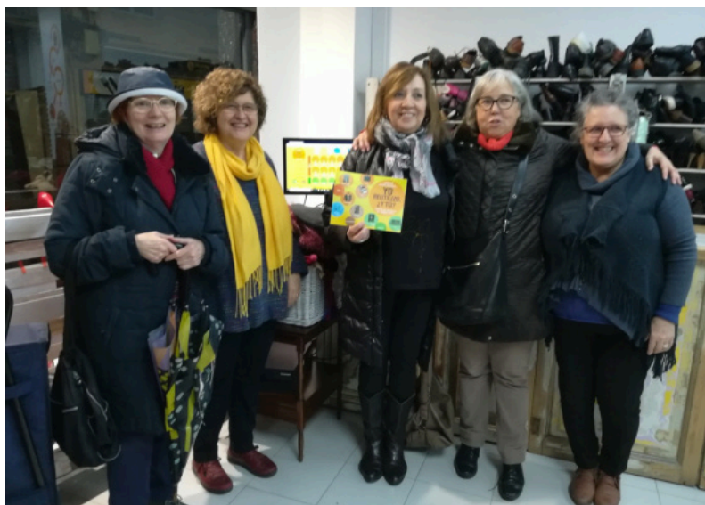
Les voluntàries de la campanya "Jo reutilitzo, i tu?" explicaven els beneficis mediambientals i socials que suposa el consum responsable.