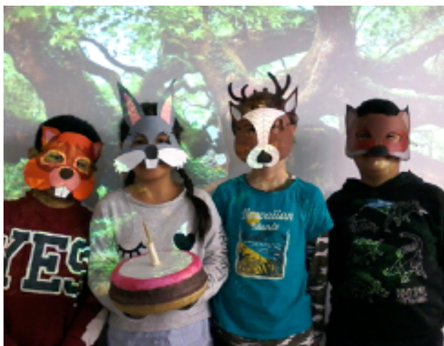
Activitat "Tenir cura del bosc", obra de teatre dels alumnes de 3er de Primària del Col·legi Urgell per alumnes de P-3.