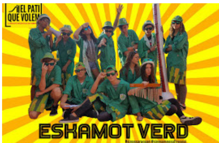
Imatge de l'Eskamot Verd al blog i les xarxes socials.