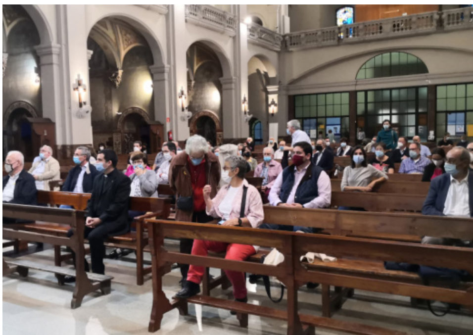
Assistents al Jubileu per la Terra.

https://www.catalunyareligio.cat/ca/centenar-cristians-demanen-sabat-terra