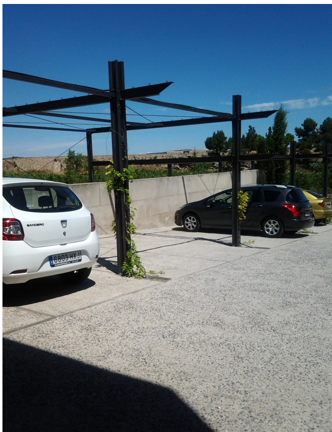
L'aparcament tindrà coberta vegetal.