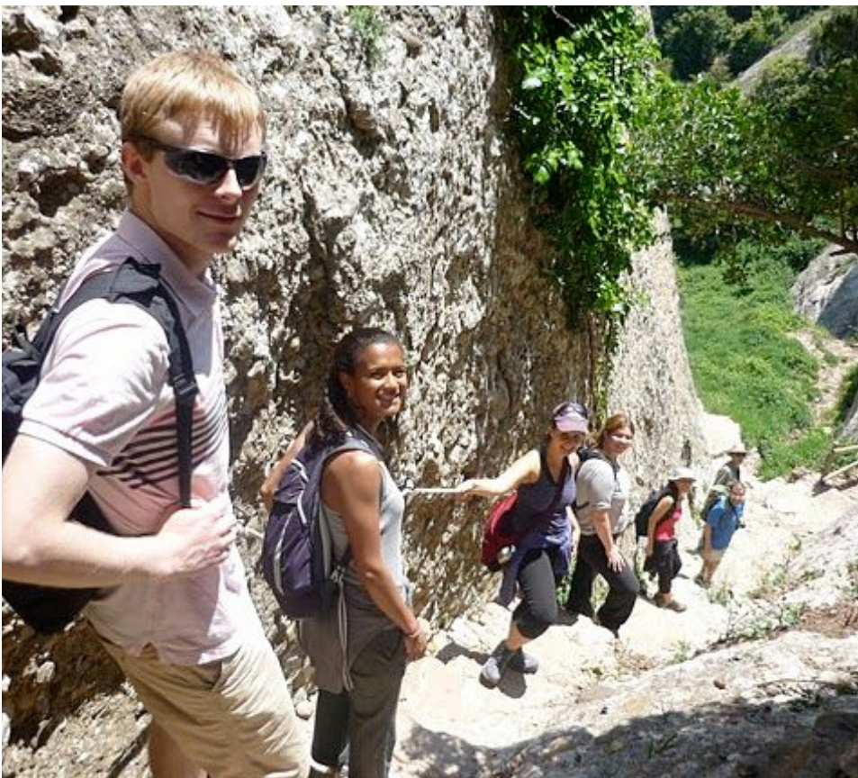
Excursió a Montserrat organitzada per la comunitat Bahá'í de Barcelona.